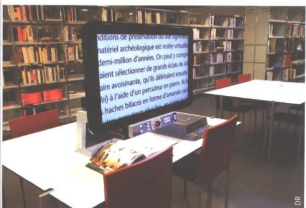
Les bibliothécaires tchèques de la SKIP en visite à la bibliothèque multimedia intercommunale d'Épinal-Golbey (Vosges)...

Avant de partir pour Rosières où nous logions, nous avons eu le temps de visiter le centre historique de Troyes avec sa cathédrale Saint-Pierre-et-Saint-Paul et ses maisons à colombage datant du XVI e siècle.