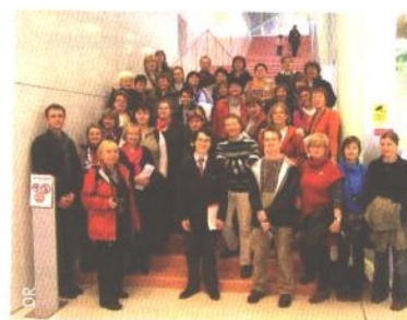
Les bibliothécaires tchèques de la SKIP.

Nous publions régulièrement dans nos pages les impressions de voyage des bibliothécaires français. Retournons pour une fois l'objectif : ce sont nos collègues tchèques de la Skip qui nous en donnent l'occasion, de retour de leur voyage à travers la Champagne, l'Alsace et la Lorraine.