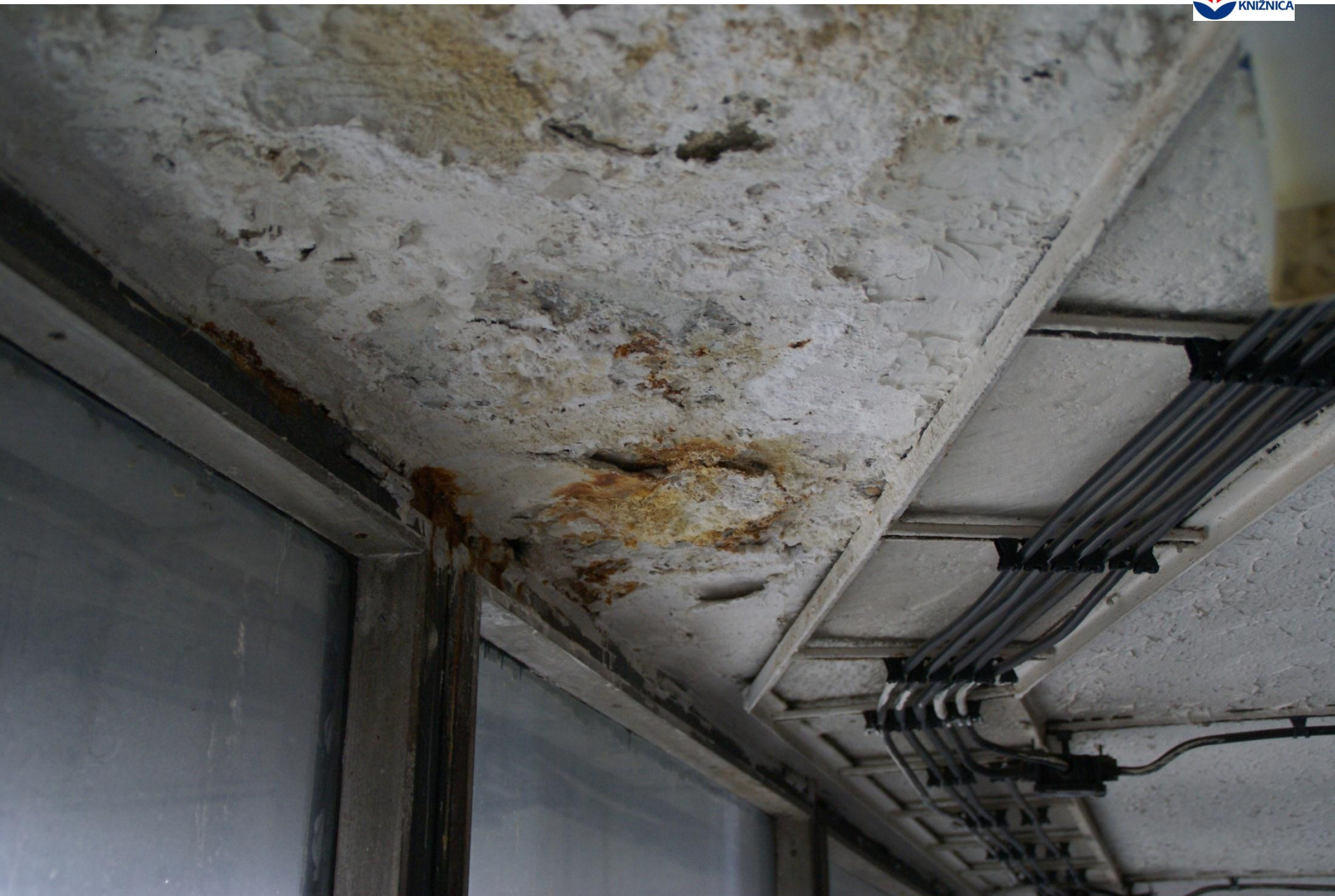
Praha, AKM, 2011