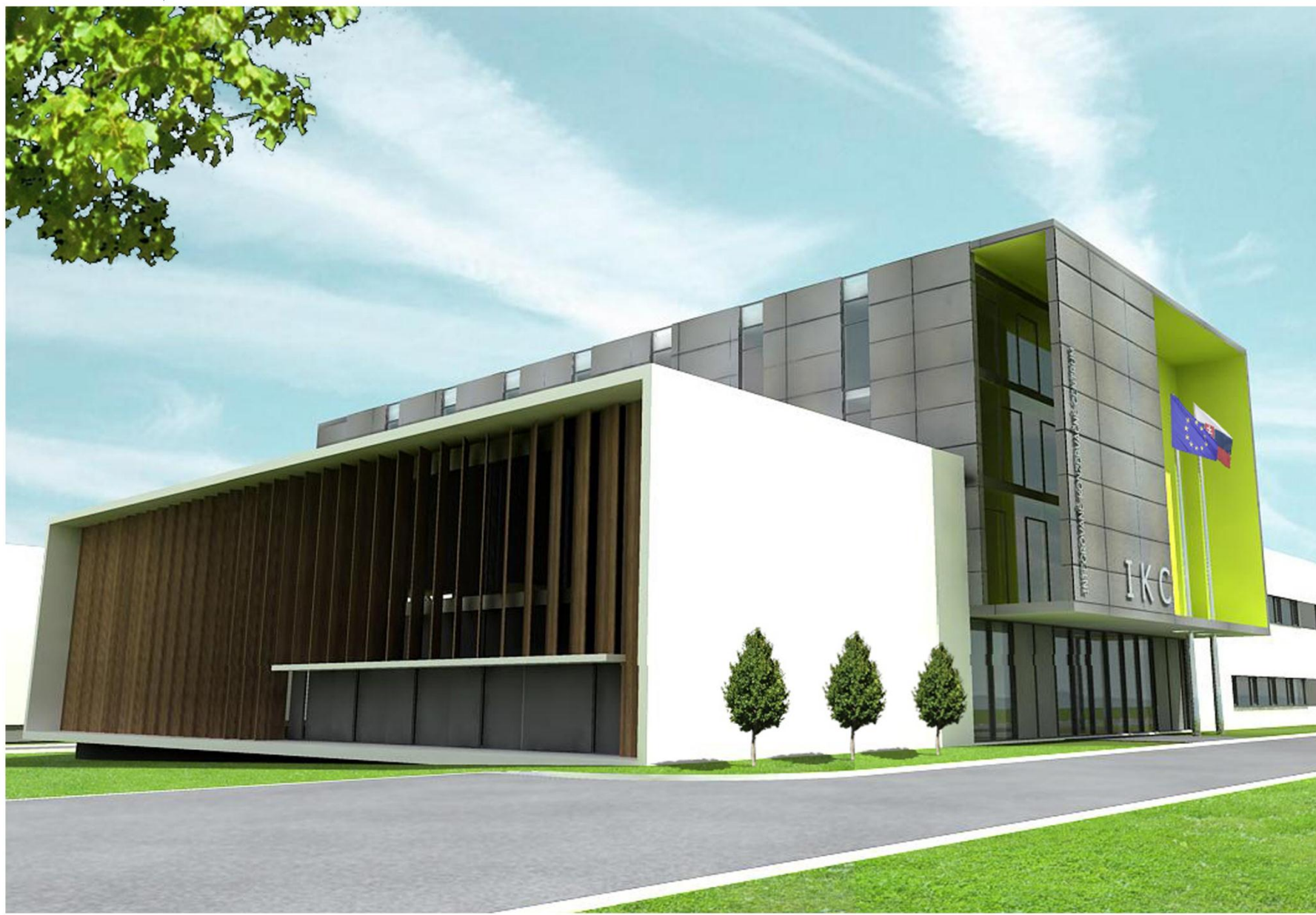
Praha, AKM, 2011