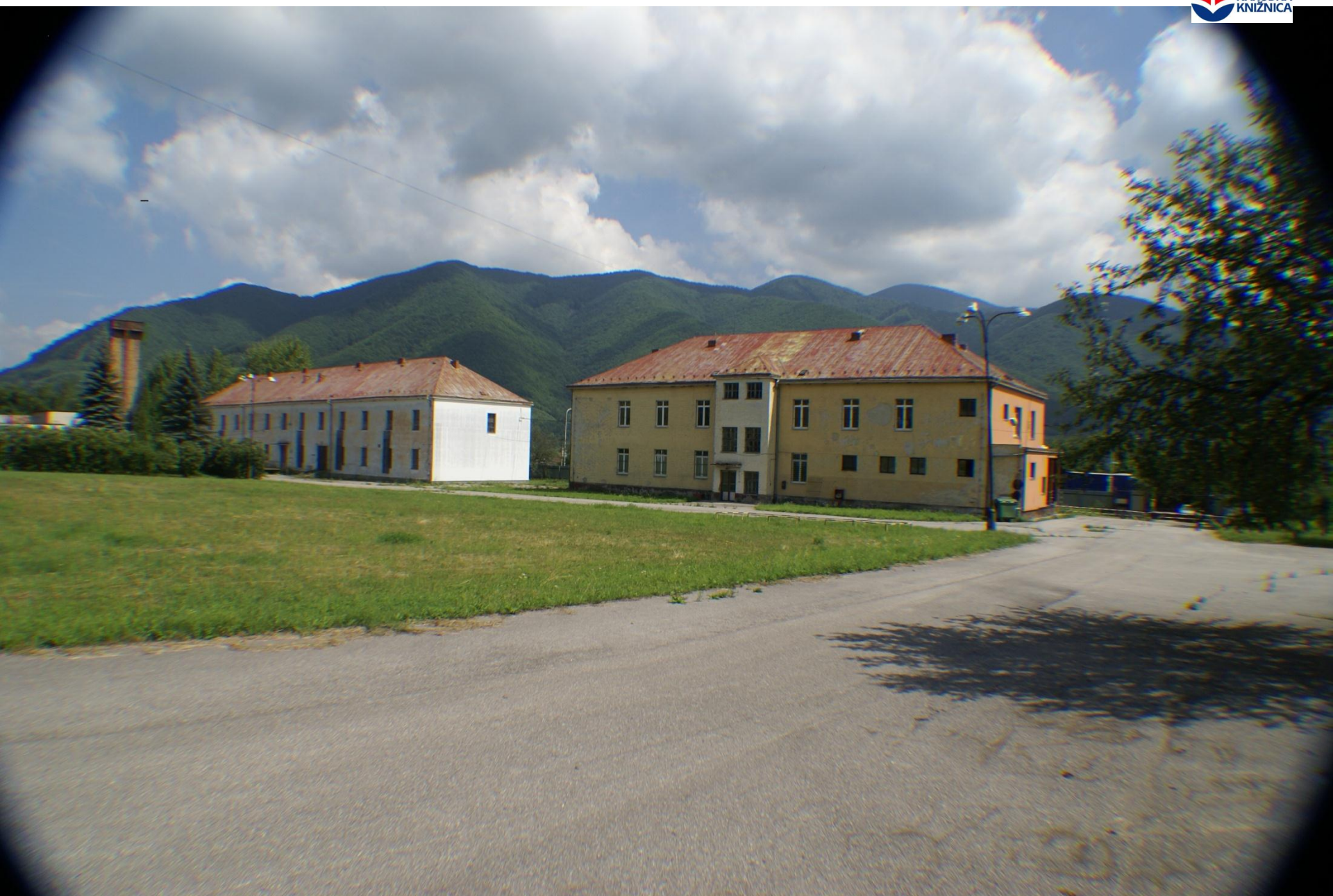
Praha, AKM, 2011